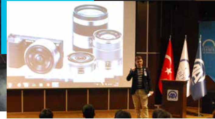
FOTO MUHABİRLİĞİ DERSLERİ

Tüm bu hedefler doğrultusunda, 100. Yıl Vizyonu da göz önünde bulundurularak AA Haber Akademisi "Yeni Nesil Gazeteci" yetiştirmek ve insan kaynağı sağlamak amacıyla "Foto Muhabirliği Eğitimi" düzenlenmektedir.